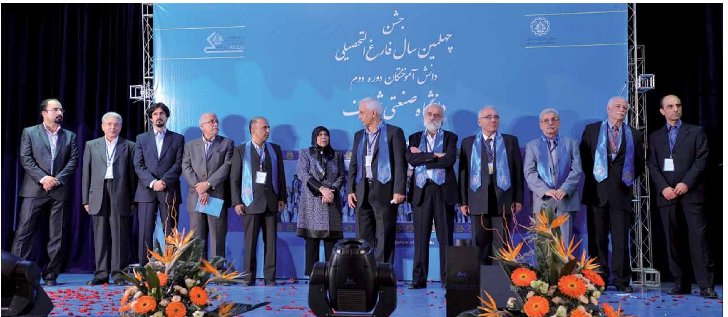
جشن اختتامیه کار یک ساله گروهی از فارغ التحصیلان بود که شامل بخشهای متنوعی از جمله نمایشگاه عکس های قدیمی و دستاوردها، تجزید خاطرات، تجلیل از استادان و پیشکسوتان و اهدای تندیس به دوره دورمیاها بود.