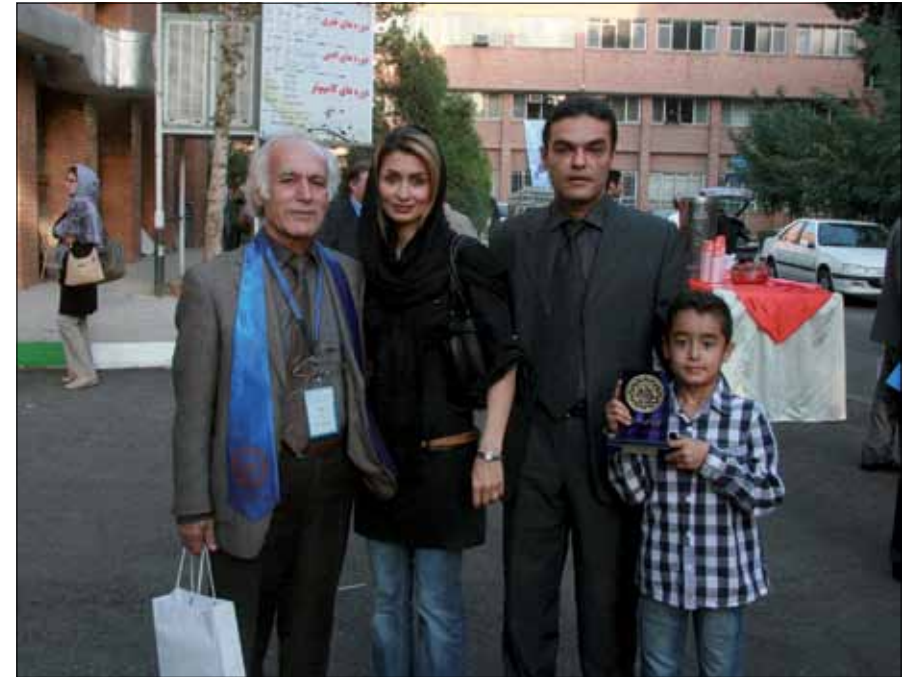
حضور فارغ التحصیلان و اعضای هیئت علمی دوره دوم به همراه خانواده هایشان گذر زمان را به یاد می آورد، چرا که چهل سال پیش در چنین روزی جوانترهای خانواده به دنیا نیامده بودند.